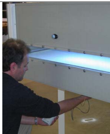
Abb. 1 Versuchsanlage DecAx mit variablen Volumenstrom und UV-C Entkeimung