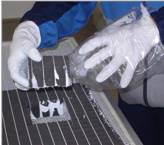
Abb. 2: Entnahme der Filterproben nach UV-C-Bestrahlung

Filter 2 – Abmessung 1220 x 915 x 69 – Der Filter wurde ebenfalls nach 16 Monaten aus der selben Produktionsanlage entnommen. Das Schwebstofffiltermodul wurde einer definierten UV-C-Bestrahlung mit unterschiedlicher Intensität und Bestrahlungsdauer ausgesetzt. Nach jedem Bestrahlungszyklus wurden Filterstücke von circa 10 x 10 cm entnommen (Abb. 2). Die Energiemenge, das Reflektat und der Abstand der Strahlungsquelle zur Oberfläche des Filtermediums wurden so ausgewählt, dass eine optimale und vollflächige Oberflächenentkeimung mit durchdringender Tiefenwirkung erreicht wird. Der Versuch wurde auch dahingehend ausgedehnt, den Einsatz von neuen Schwebstoff Filtern durch eine kontinuierliche Bestrahlung von vornherein durchgehend gegen eine Verkeimung zu schützen. Angenommen wurde einen Kontamination durch Aspergillus Niger (Lethaldosis zur 90% Inaktivierung 160.000 Mikrowatt).