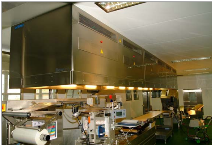
Abb. 4: Laminar Flow System der Type DecAx als Minienvironment mit integrierter Entkeimungseinrichtung

Mit den Erkenntnissen aus den regelmäßigen Untersuchungen, aber speziell aus dieser Testreihe, ergeben sich neue Perspektiven der Raum- und Anlagenkonzeption. Lebensmittelverarbeitende Produktionsstätten sind als Raum nur schwer vollflächig keimfrei zu halten oder der Raum als Reinraum zu betreiben. Die Zukunft liegt darin, spezielle Anlagen mit höchst möglicher Sicherheit zu entwickeln und diese Zonen zu schützen an denen das Produkt den meisten Gefahren ausgesetzt ist. Komplexe Anlagen wie z.B. Laminar Flow Systeme der Type DecAx als „Mini Environment“ mit integrierten Entkeimungseinrichtungen sind ein Ergebnis innovativer Reinraumtechnik (Abb. 4)